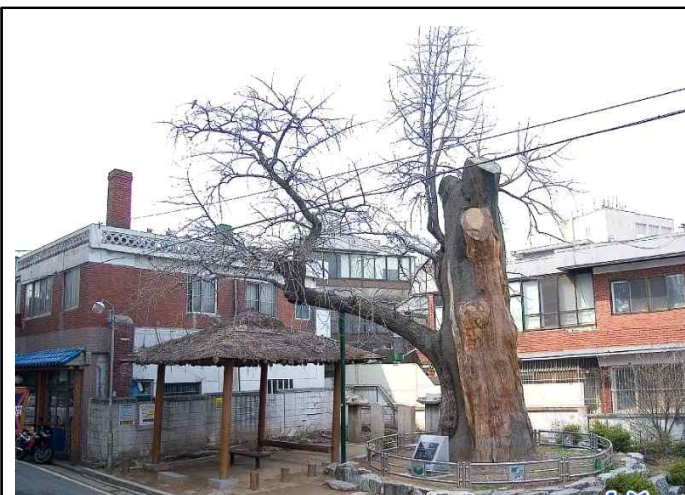
· 은행나무3.(예향교회 옆, 시흥5동센터 건너편)