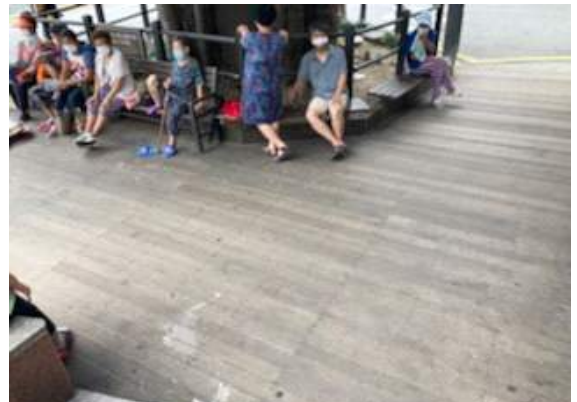
· 은행나무1.(카멜리아사우나 앞, 바닥)