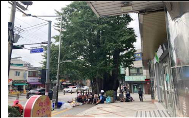
· 은행나무1.(카멜리아사우나 앞)