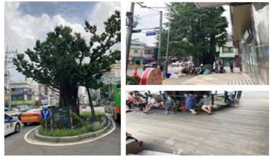
[그림 2. 금천구 행정구역도 / 시흥5동 은행나무사거리 일대 전경]