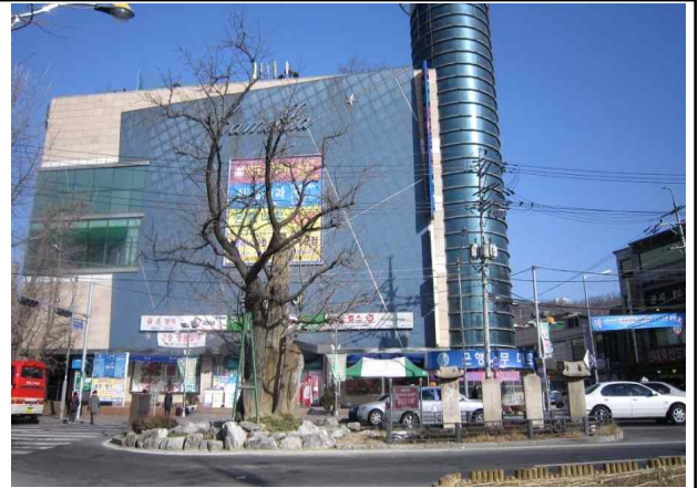
· 은행나무2.(은행나무사거리 중앙)